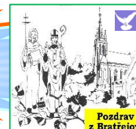
Pozdrav z Bratřejova

Každý, kdo pije tuto vodu, bude opět žíznit. Kdo se však napije vody, kterou mu dám já, nebude žíznit navěky, a stane se v něm pramenem vody tryskající do věčného života -