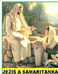
JEŽÍŠ A SAMARITÁNKA

• E.T. Seton: Protože jsem poznal trýzeň žízně, chtěl bych vykopat studnu, ze které by mohli pit i jiní •