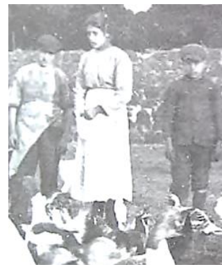
Sv. Marie Goretti v r. 1902 se svými bratry

Nono, copak nemáte čas?! zaskuhral písař, posunul si brýle na čelo a přeměřil sourozence kosým pohledem. Záleží na tom, koho s tím časem myslíte, usykával Angelo, jestli mne, tak vás mohu ubezpečit, že sedlák nemá nikdy čas, někde jen tak postávat - Sedlák?! posmíval se kancelista. Ono je to už sedlák a já myslel, že je to ještě mličňák - Myslím, že byste si měl pospíšet s vybíráním nájemného - A on, kdopak vůbec je? ptal se písař a sáhl rychle po péru a škrábal něco ve svých papírech. Ten – on, je synem pachtýřky Gorettiové z Le Ferriere a rád by zaplatil zbytek nájemného. A jestli vy nemáte naspěch, pak my ano. Na to vytáhl Angelo kožený váček, napočítal na stůl patnáct stříbrných mincí a žádal o potvrzení. Ach ja, Goretti, vzpomínal si výběrčí, listoval ve své hlavní knize a něco si tam připsal. No ovšem, Goretti. A tvoje sestra, to je ta pěkná žabička, která si dělá jen posměšky z vážných lidí, a vyčítavě se zadívala na děvče, které klopile zahanbeně své oči k zemi. Angelo už měl na jazyku peprnou odpověď, ale Marietta ho pohledem a stiskem ruky uprosila, aby mlčel a nedráždil starého písaře.