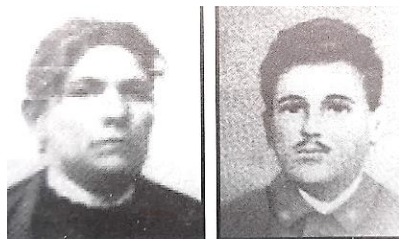
Assunta a Luigi Goretti

Co chvíli se objevil některý ze sousedů a nabízel pomoc, přinesl nějaké jídlo, nebo nápoj, po němž, jak doufali, se nemocnému uleví. Pastýř Petr chodíval vícekrát za den, ale netajil se tím, že je se svým uměním v koncích.