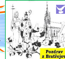
Pozdrav z Bratřejova

Každý, kdo pije tuto vodu, bude opět žiznit. Kdo se však napije vody, kterou mu dám já, nebude žiznit navěky, a stane se v něm pramenem vody tryskající do věčného života - Jan 4,13-15 ▶ Ježíš rozmlouvá se Samaritánkou - YouTube