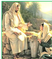
JEŽÍŠ A SAMARITÁNKA

• E.T. Seton: Protože jsem poznal trýzeň žizně, chtěl bych vykopat studnu, ze které by mohli pit i jiní •