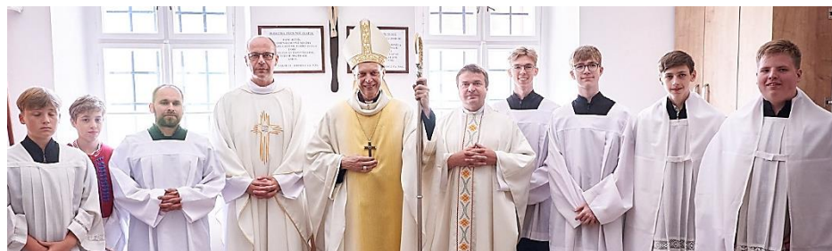
Aktivní služebníci oltáře při bohoslužbě k příležitosti znovuoživení nemocnice Mil. Bratří ve Vizovicích