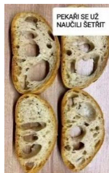
PEKAŘI SE UŽ NAUČILI ŠETŘIT

Přijde opilý muž domů a za dveřmi na něj čeká naštvaná tchyně s koštětem. Muž: zametáte nebo odlétáte? ♦ Únoscí: Unesli jsme tvou tchyni, posli 100 000 dolarů – A když ne? – Tak ti ji pošleme naklonovanou ♦ Optimista je muž, který se těší na manželství. Pesimista je ženatý optimista ♦ Fero, jak dlouho tu chytáš ryby? - Asi tři roky - A to ti nedošlo, že tady žádné ryby nejsou? - Ani ne, ale teď začínám mít pochybnosti ♦ Včera jsem nasela okurky a dneska je mám venku - Tak rychle? a co je to za odrůdu? - Normální, slepice je vytahaly ♦