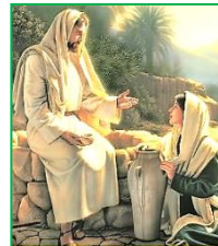
JEŽÍŠ A SAMARITÁNKA

♦ E.T. Seton: Protože jsem poznal trýzeň žízně, chtěl bych vykopat studnu, ze které by mohli pít i jiní ♦