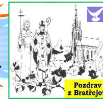
Pozdrav z Bratřejova

Každý, kdo pije tuto vodu, bude opět žíznit. Kdo se však napije vody, kterou mu dám já, nebude žíznit navěky, a stane se v něm pramenem vody tryskající do věčného života -